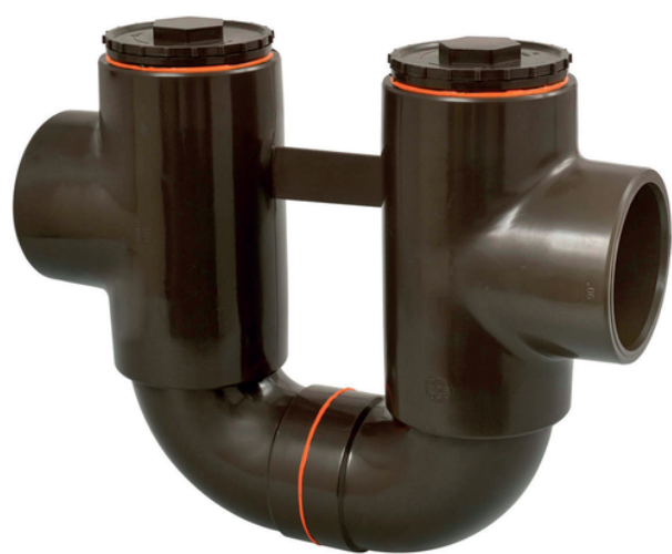
Sifón en línea HTA-E